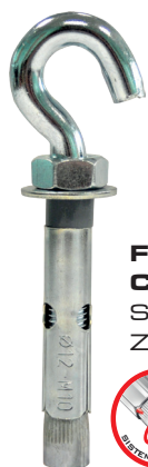
FIXBOLT GANCHO CINCADO SLEEVE ANCHOR HOOK ZINC PLATED