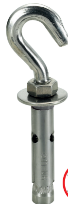
FIXBOLT GANCHO INOXIDABLE A2 SLEEVE ANCHOR HOOK STAINLESS STEEL AISI 304