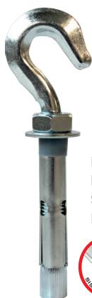
FIXBOLT GANCHO ESTAMPADO SLEEVE ANCHOR FORGED HOOK